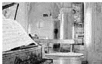
Qui sopra, due immagini di San Colombano Collezione Tagliavini